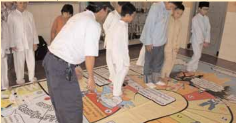
Indonesian Red Cross Society

ПМИ создало специальную игру «Змея и лестница» в целях повышения информированности детей о стихийных бедствиях.