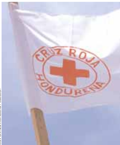
Yoshi Shimizu/International Federation

Н ациональная дирекция по делам молодежи Гондурасского общества Красного Креста осуществила программу по вопросам подготовки и повышения информированности молодых добровольцев с целью содействия усилиям по борьбе с дискриминацией и уважению разнообразия.