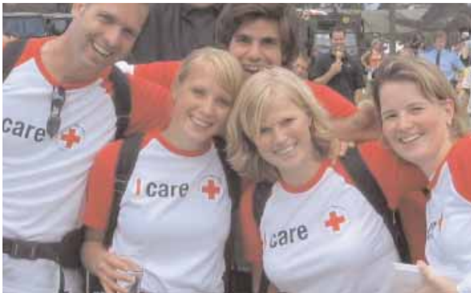
Danish Red Cross

Для того, чтобы создать дружелюбную, открытую и приятную обстановку, проведите экспресс-опрос среди членов общества и добровольцев. Обсудите в группе следующие вопросы. Они помогут определить, насколько вы дружески расположены, открыты и радушно настроены. ■