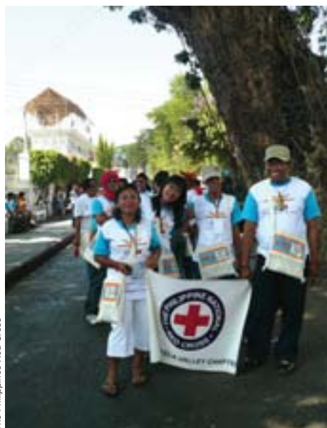
The Philippines Red Cross

Члены Филиппинского общества Красного Креста на Молодежном конгрессе.