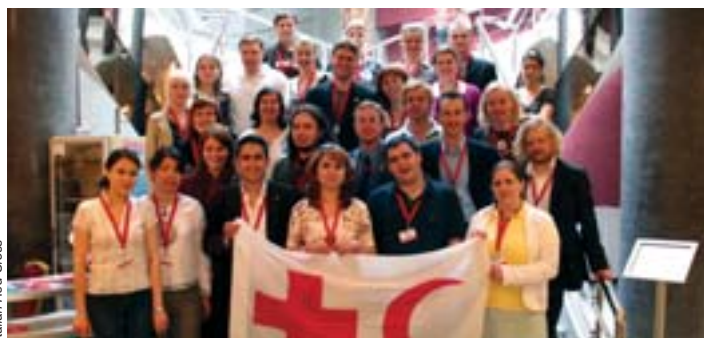
Italian Red Cross

7-я Европейская конференция Международной федерации состоялась в Стамбуле, Турция, с 20 по 24 мая 2007 года. 52 европейских общества Красного Креста и Красного Полумесяца обсуждали последние изменения и определяли направления деятельности в области здравоохранения и миграции. До начала работы Конференции было проведено совещание всех молодежных делегатов с целью обсуждения позиций молодежи по этим вопросам. Благодаря вовлечению молодежи в процессе подготовки к конференции, в общей сложности 35 представителей молодежи активно участвовали в этом важном совещании. Кроме того, многие выступления и доклады во время проведения тематических рабочих семинаров наглядно продемонстрировали вклад молодежи КК/КП, который она делает в области здравоохранения и миграции. Национальные общества признали этот вклад и официально усилили роль молодежи в достижении будущих общих целей. В конце Конференции они обязались привлекать представителей молодежи к разработке и осуществлению программ на всех уровнях и поощрять подход, основанный на взаимном обучении.