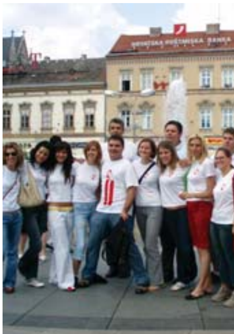
Croatian Red Cross