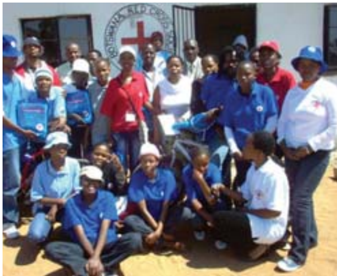
Botswana Red Cross

Участники курсов подготовки по вопросам управления стихийными бедствиями в Канье, Ботсвана.