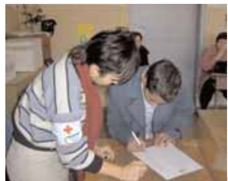
Болгарское общество Красного Креста

Дети и молодые люди из этого сиротского учреждения были активными участниками всех этапов этого процесса, включая оценку потребностей, планирование и осуществление проекта, а некоторые из участников также стали молодыми добровольцами БОКК. ■