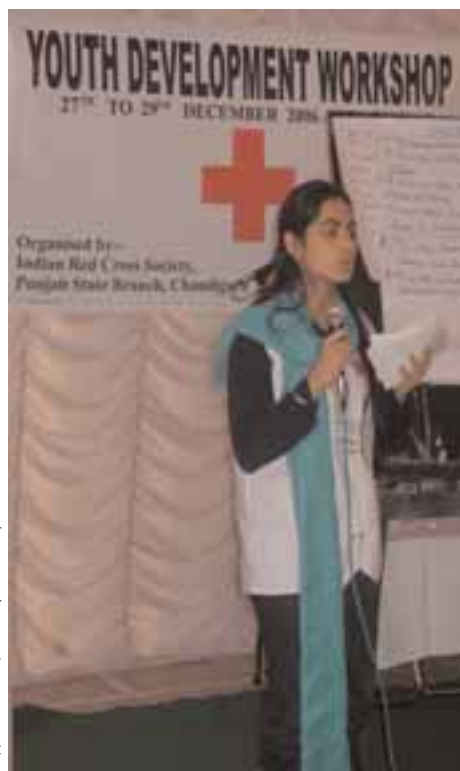
Индийское общество Красного Креста

С целью обеспечения более широкого участия молодежи в работе Индийского общества Красного Креста (ИОКК), усиления потенциала юниорской и молодежной организаций ИОКК и распространения гуманитарных ценностей среди молодежи, в Пенджабском отделении общества был организован молодежный семинар с участием соседних отделений. 50 молодых добровольцев в возрасте от 18 до 25 лет участвовали в трехдневном молодежном семинаре и узнали больше о Движении, добровольчестве среди молодежи, гуманитарных ценностях, методах руководства и средствах связи. Были также организованы сессии по различным видам деятельности ИОКК, таким как профилактика ВИЧ/СПИДа и борьба со стихийными бедствиями.