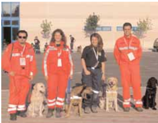
Итальянское общество Красного Креста

Этот вид деятельности привлекает многих молодых добровольцев. Учебно-